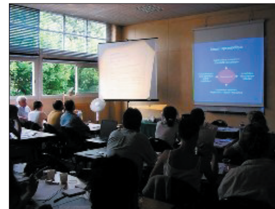
Les cours sont entièrement réalisés en vidéoprojection.

Un certificat de stage pratique iridologique sera remis à tous les participant ayant assisté à l'ensemble du séminaire.